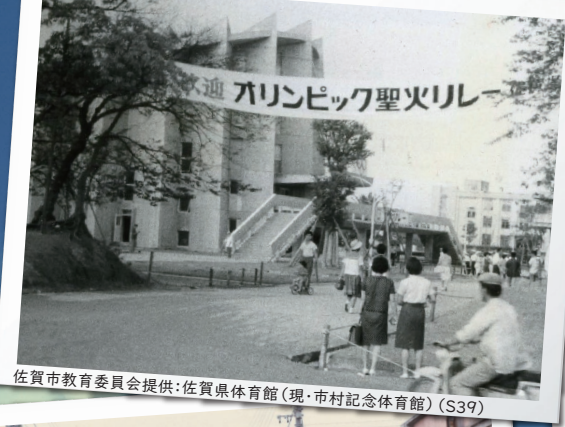
佐賀県体育館（現・市村記念体育館）(S39)