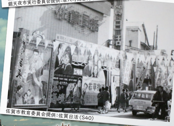
佐賀市教育委員会提供・佐賀日活(S40)