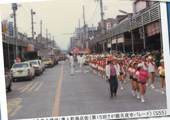
唐人町商店街（第15回さが銀天夜市パレード）(S55)