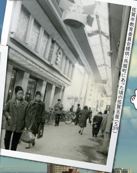
呉服町にある頃の佐賀玉屋(S39)