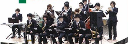
ポルケテロ・インパクト・ジャズオーケストラ