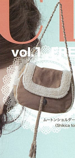
ムートンショルダーBag (Shikica tokyo)