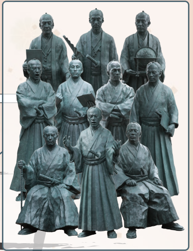
古賀毅堂・鍋島直正・鍋島茂義 枝吉神陽・大隈重信・島義勇・大木喬任 副島種臣・江藤新平・佐野常民

さまざまな困難を乗り越え、 時代を駆け抜けた佐賀の偉人たち。 等身大のモニュメントをめぐり歩き、 その功績に触れながら佐賀の歴史を学びます。 まち歩きの際は、全員で「健康祈願」のお参りをし、 お昼は社務所で「義祭弁当」をいただきます。