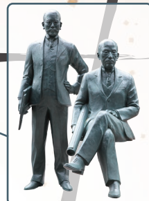
辰野金吾・曾禰達蔵