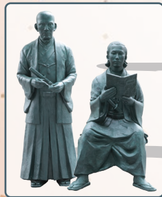
伊東玄朴・相良知安